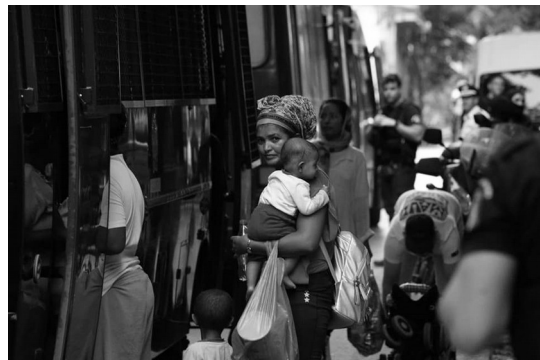
DECENAS DE DESALOXS EN ATENAS

Continúan as mobilizacións e as accións de resposta.