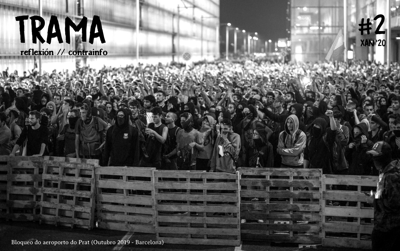
Bloqueo do aeroporto do Prat (Outubro 2019 - Barcelona)