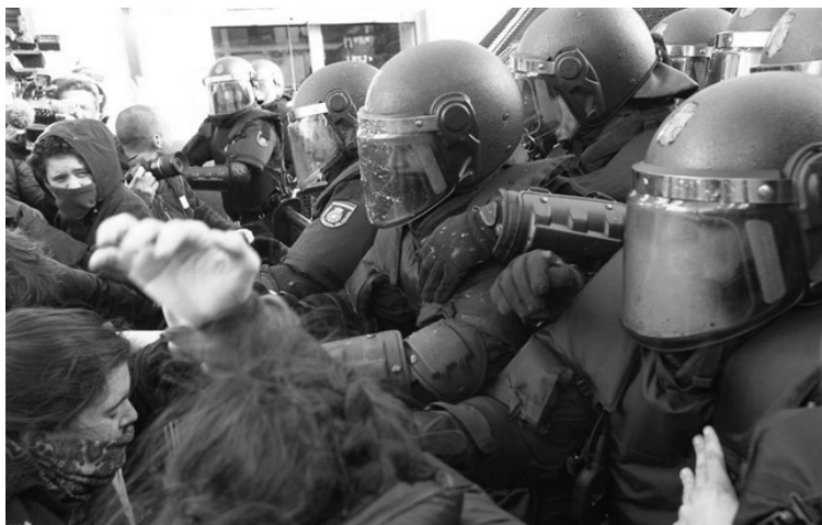
DESAFIAMENTOS EN LAVAPIÉS (MADRID)

Informáronnos que traían unha orde de rexistro e de detención para dúas de nós baixo a acusación de terrorismo.